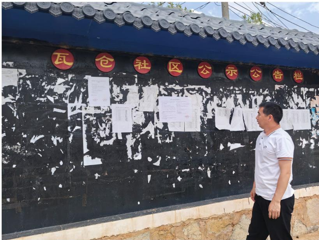
图13 瓦仓社区现场信息公示粘贴