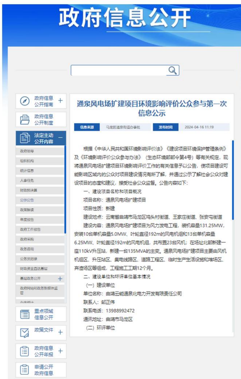
图 1 第一次信息公示截图

根据《环境影响评价公众参与办法》，建设单位于2024年4月16日在马龙区人民政府网站（ https://malong.gov.cn/gov/public/detail/tzgg/79785.html ）网站上进行首次环境影响评价信息公开。网络公示截图见下图。