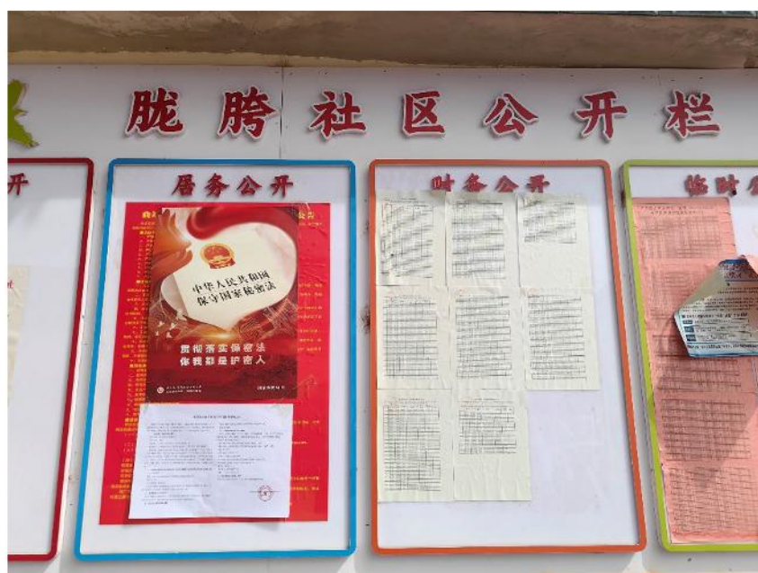
图9 龙腾社区现场信息公示粘贴