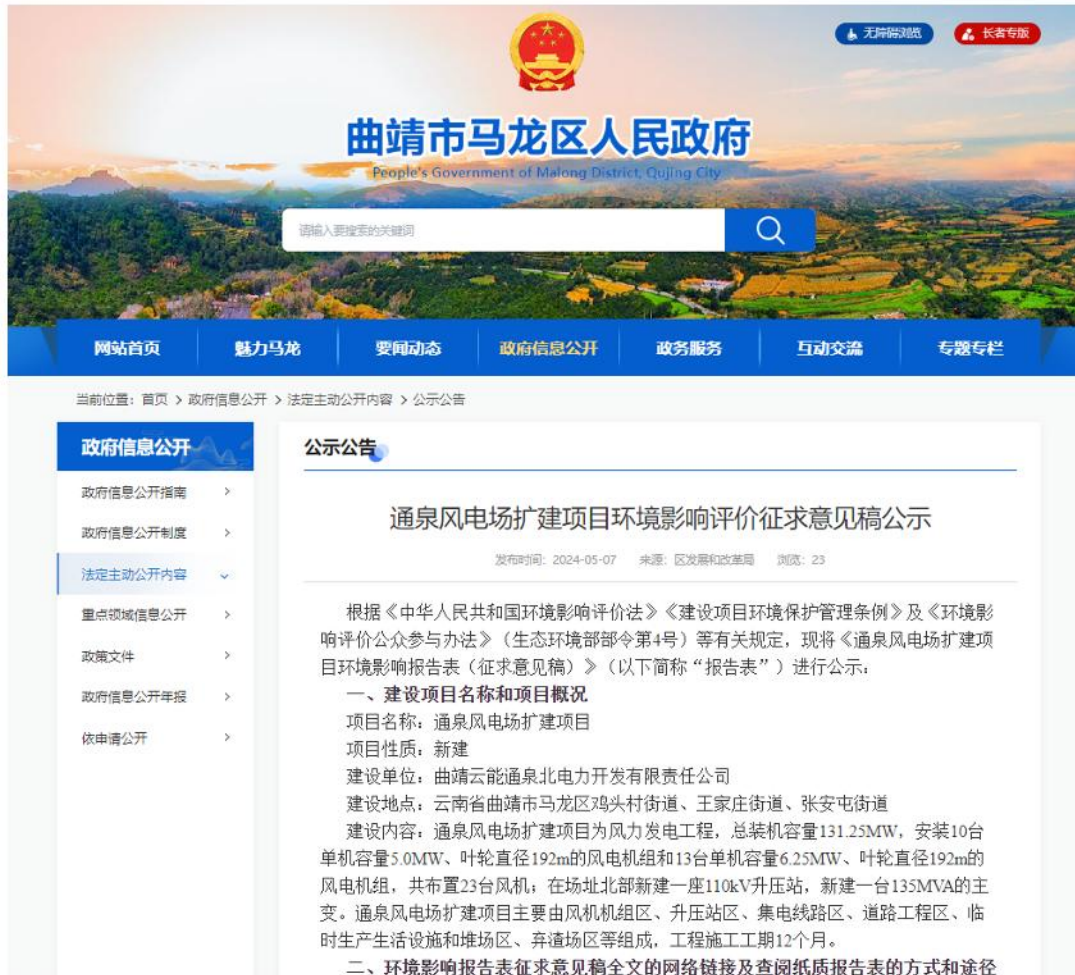
图3 征求意见稿网络公示截图2