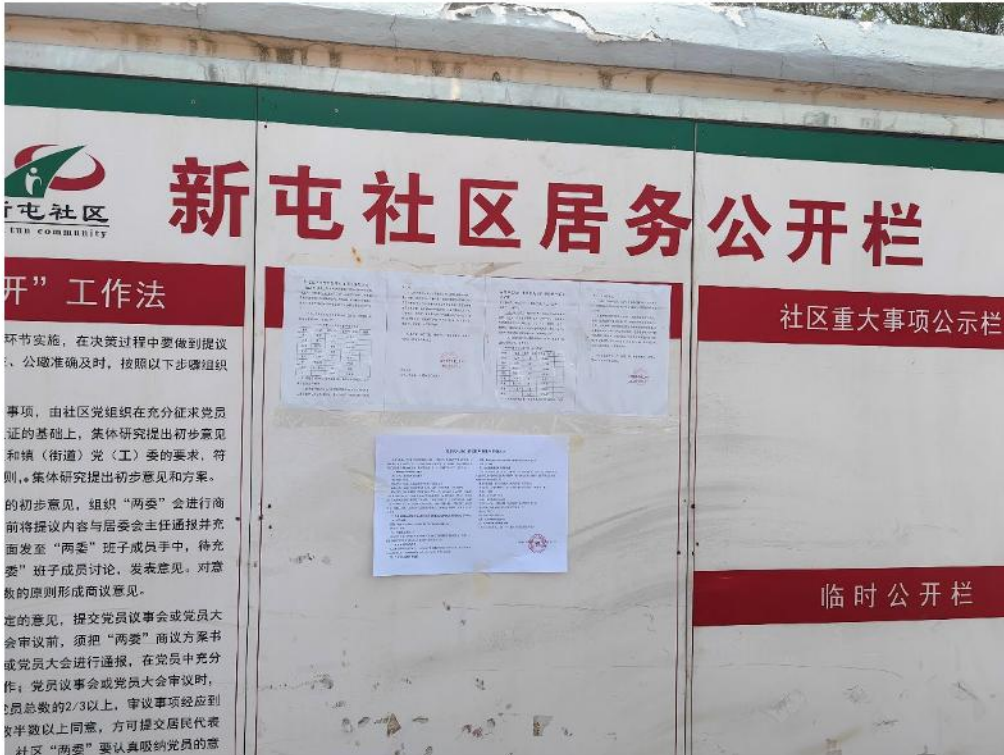
图11 新屯社区现场信息公示粘贴