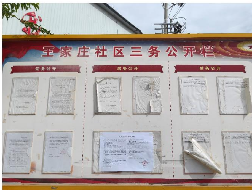
图8 王家庄社区现场信息公示粘贴

我单位于2024年4月16日至2024年4月28日在曲靖市马龙区王家庄社区、龙腾社区、永发社区、新屯社区、小屯社区、瓦仓社区粘贴公众参与公示进行信息公开，以便公众参与及反馈意见。粘贴区域的选取符合《环境影响评价公众参与办法》第十一条规定：“通过在建设项目所在地公众易于知悉的场所张贴公告的方式公开，且持续公开期限不得少于10个工作日”。