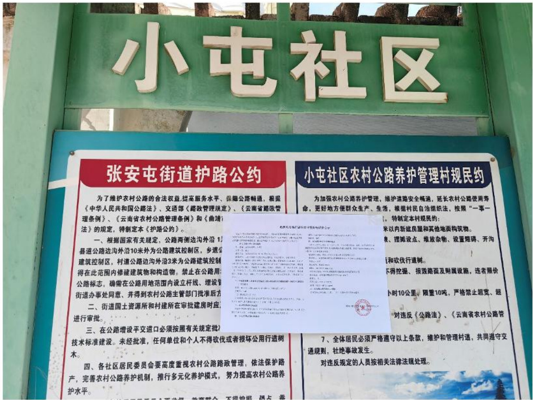
图12 小屯社区现场信息公示粘贴